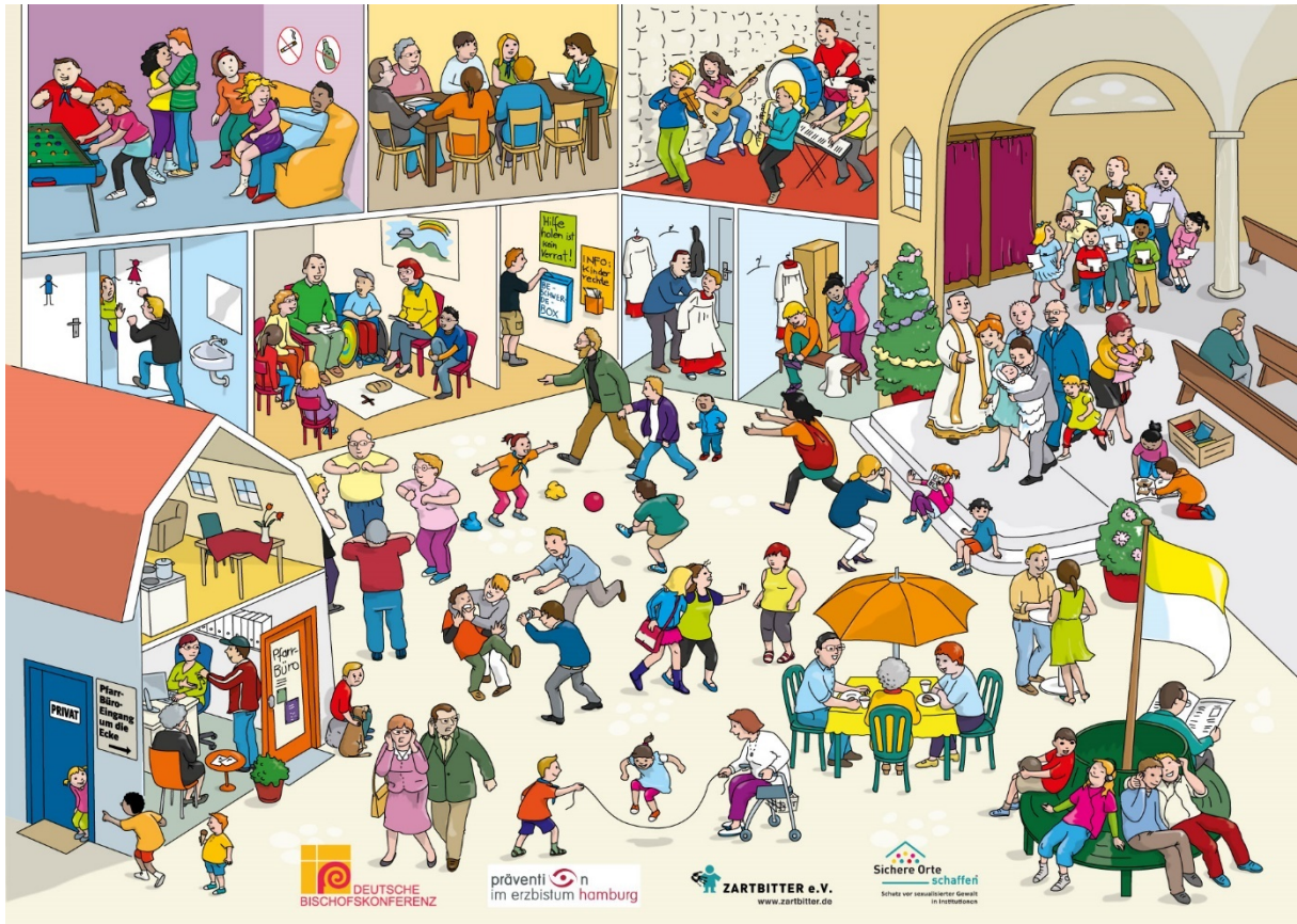
Abb. 3 Wimmelbild Pfarrei